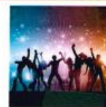
DANCING, SORTIES « EN BOÎTE »

Dépenses à diminuer = les économies/ réductions à faire/demander