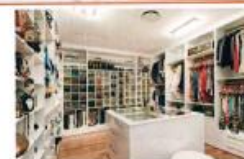
VÊTEMENTS / CHAUSSURES