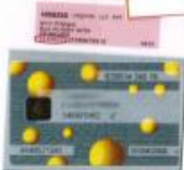
COTISATION DE MUTUELLE